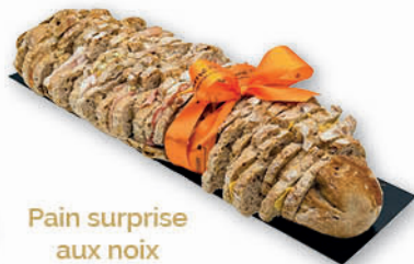
Pain surprise aux noix