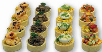
Mini tartelettes végétariennes